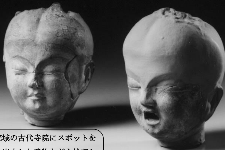
滋賀県史跡雪野寺跡出土 童子形塑像

今回の講座では、日野川中流域の古代寺院にスポットをあて、個々の遺跡の発掘成果や出土した遺物などを検証し、古墳時代末期から奈良時代にかけての雪野山周辺の歴史的環境や地域性について考えていきます。