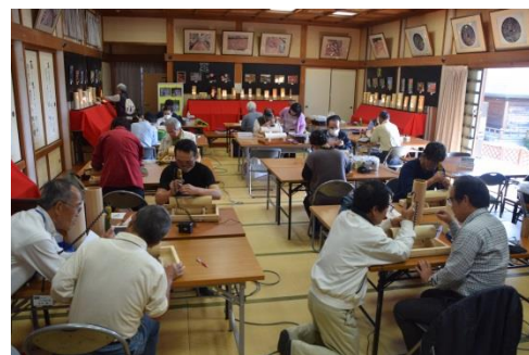
みんなで和気あいあい受講会場