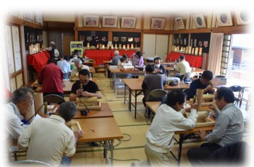
みんなで和気あいあい受講会場