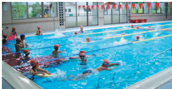
ドラゴンスポーツセンター プール

※2025年4月1日～2026年3月31日の間 ※通常料金 / 〈プール〉 大人：410円、子ども：200円