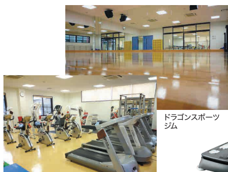
ドラゴンスポーツ ジム