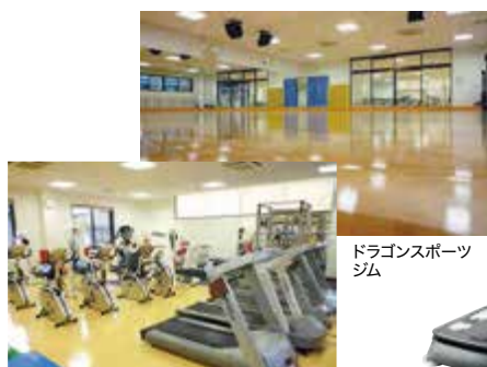
ドラゴンスポーツ ジム