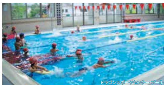
ドラゴンスポーツセンター プール

※2026年4月1日～2027年3月31日の間 ※通常料金／〈プール〉大人：410円、子ども：200円